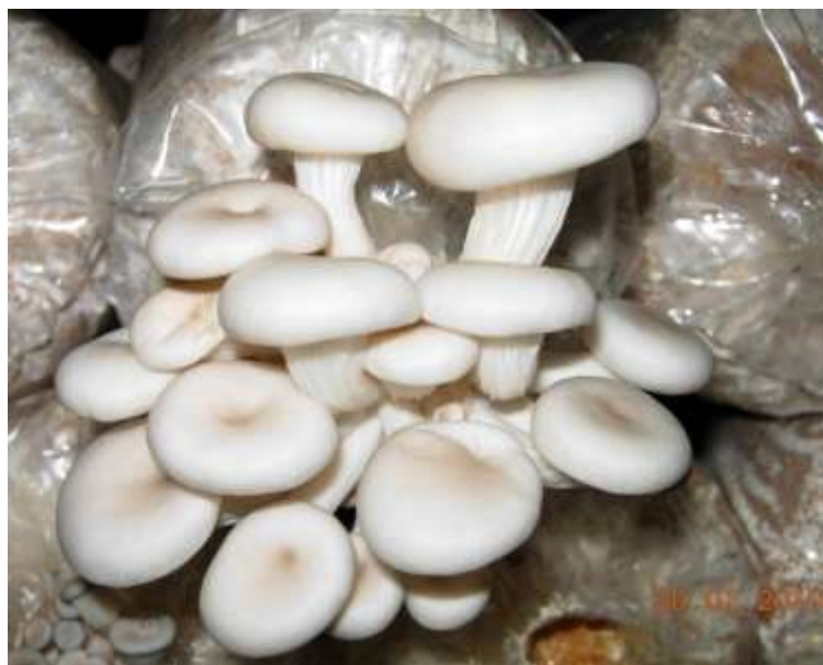
ภาพที่ ก.2 เห็ดนางรมฮังการี