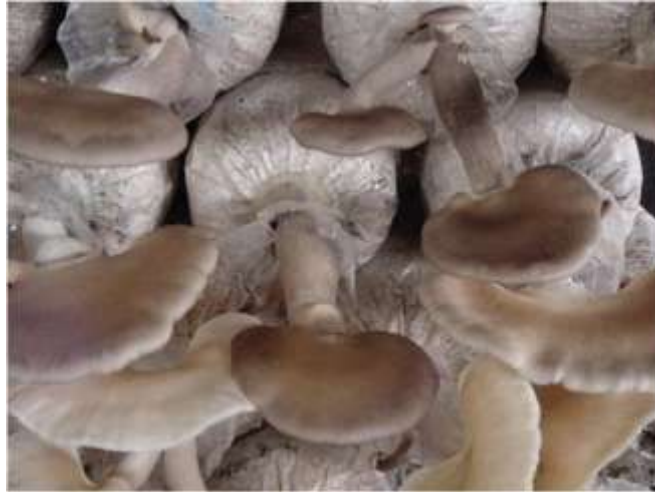
ภาพที่ ก.3 เห็ดเป๋าฮื้อ