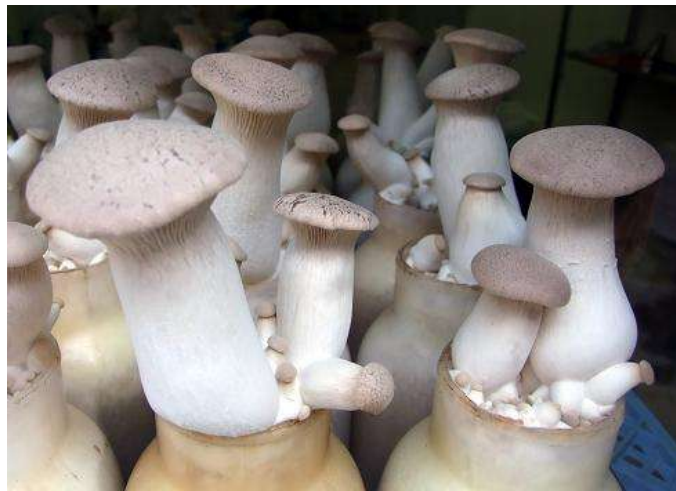
ภาพที่ ก.4 เห็ดนางรมหลวง