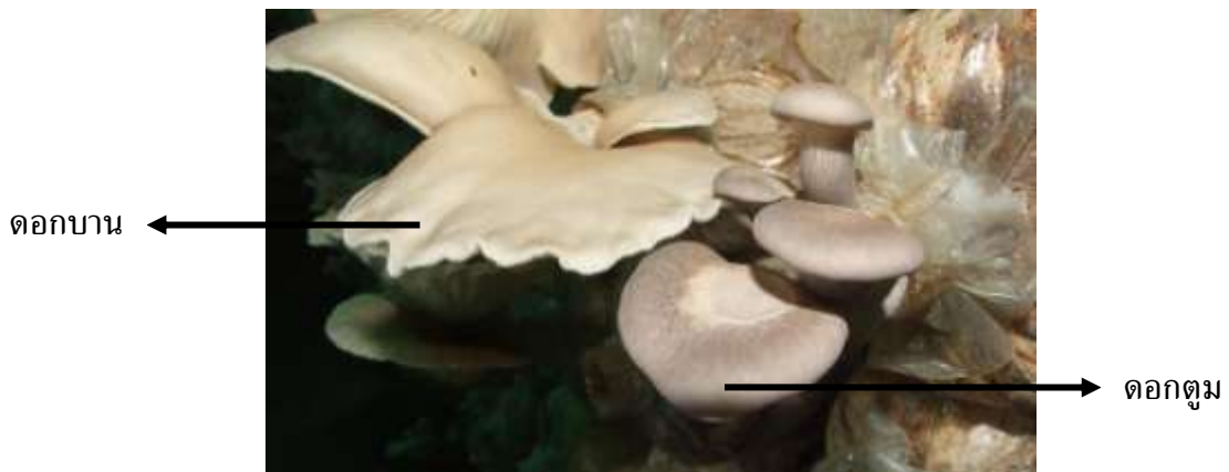
ภาพที่ ก.5 ดอกตูมและดอกบาน