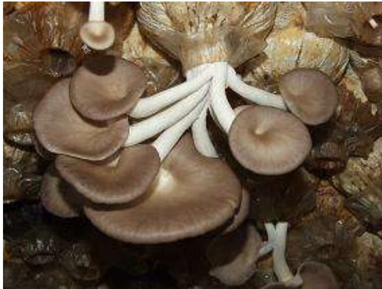
ภาพที่ ก.1 เห็ดนางรมภูฐาน

(ข้อ 1, ข้อ 2.2, ข้อ 2.3, ข้อ 2.4 และ ข้อ 4)