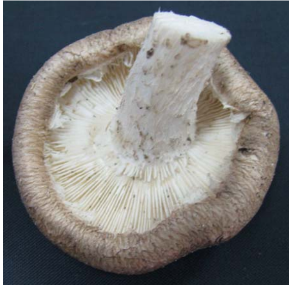
ภาพ ก.3 เยื่อไตหวมกฉีกขาดทั้งหมด