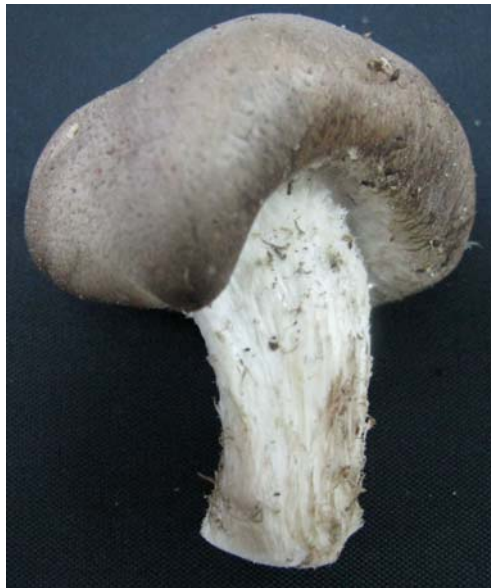
ภาพ ก.4 เห็ดหอมรูปทรงผิดปกติ