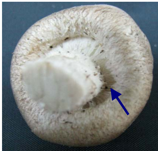
ภาพ ก.2 เยื่อใต้หมวกฉีกขาดบางส่วน