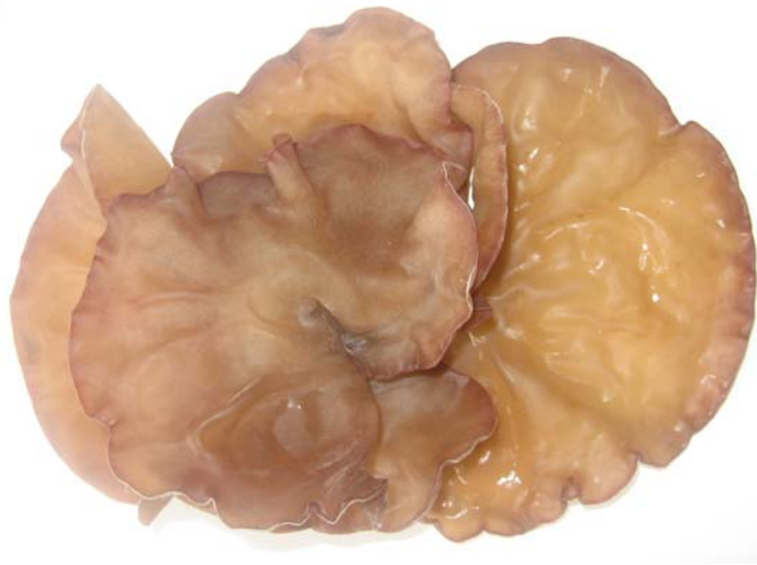
ภาพ ก.3 ดอกบานช่วย