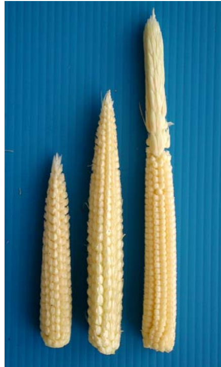
ภาพที่ ก.4 แสดงลักษณะฝักดอกหญ้า (ไม่ยอมรับ)