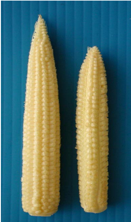
ภาพที่ ก.3 แสดงลักษณะการเรียงแถวห่าง (ไม่ยอมรับ)