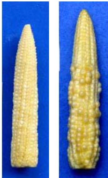
ภาพที่ ก.2 ข้าวโพดฝักอ่อนที่ฝักผิดปกติ (ลักษณะหนังคางคก) เนื่องจากไซได้รับการผสมเกสร