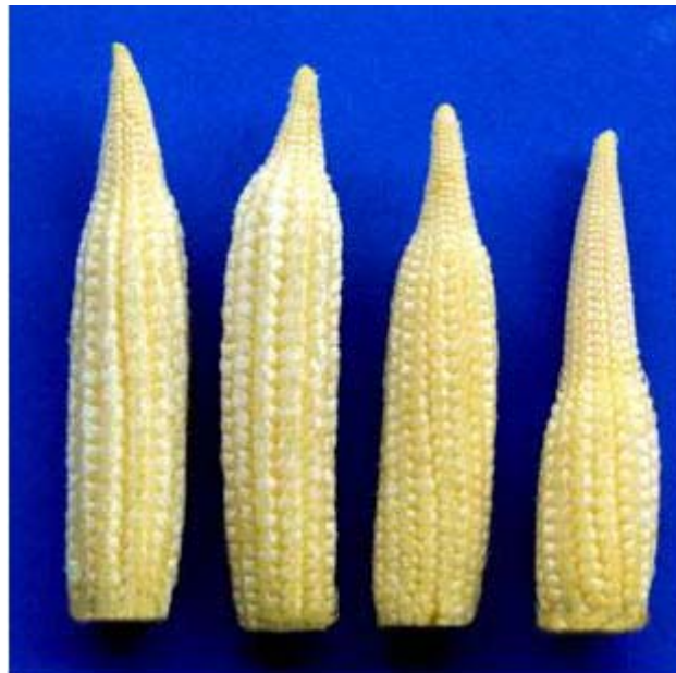
ภาพที่ ก. 5 แสดงลักษณะฝักเหมือนขวด (ไม่ยอมรับ)